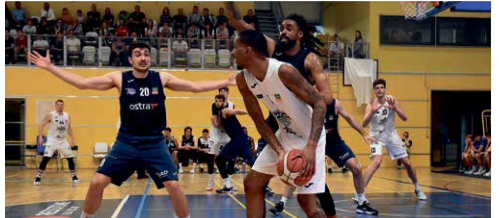
Basketbalisté BK REDSTONE Olomoucko mají ve čtvrtfinále play-off za soupeře Nymburk.

Hráči BK REDSTONE se snažili na soupeře dotáhnout a pomáhal jim v tom Klepač, který během krátké doby zaznamenal jedenáct bodů. Stačilo to ale pouze na korekci na 29:32, pak vysokoškolačci opět odskočili. V 17. minutě už ale Adamu srovnal na 37:37 po samostatné akci přes celé hřiště a začínalo se od začátku. Stejný hráč o chvíli později trojkou otočil skóre na stranu Olomoucka, které přesto první poločas prohrálo 44:45, když zbytečnou ztrátu McBrayera dokázal dvě vteřiny před pauzou potrestat Samoura.