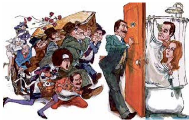
Detail původního filmového plakátu.

Waltera Matthaua). Film získal 6 nominací na Zlatý globus (režie, scénář, nejlepší komedie, herecké výkony - obě hlavní postavy a právě pro Revilla). Sošku si odnesl jen Lemmon, ale to vůbec nevadí. Wilderův snímek se stal legendou, která bude diváky okouzlovat po celou dobu, co film jako takový bude existovat. ■