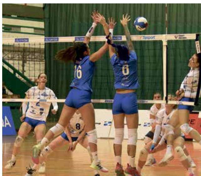
Volejbalistky TJ Sokol Šternberk nerozehrály baráž o udržení dobře.