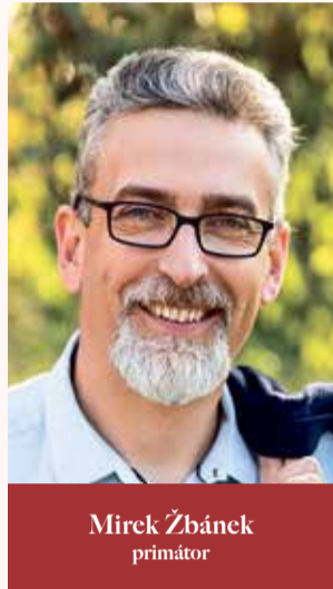
Mirek Žbánek primátor

Ptejte se vedení města Olomouce na e-mailové adrese otevrenaradnice@hanackyvecernik.cz a my Váš dotaz necháme zodpovědět!