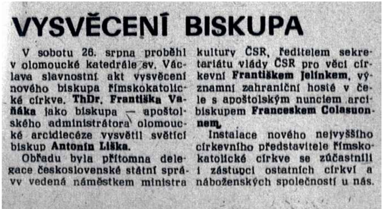
Svěcení biskupa Vaňáka v dobovém komunistickém tisku

Po Matochově smrti zůstal arcibiskupský stolec na dlouhá léta neobsazen. Jmenování arcibiskupa vyžadovalo shodu mezi Vatikánem a komunistickým režimem a ta byla na několik desetiletí nedosažitelná. Kandidáty Vatikánu režim vytrvale odmítal a proročí duchovní, ochotné ke kolaboraci s komunistickým režimem pro změnu