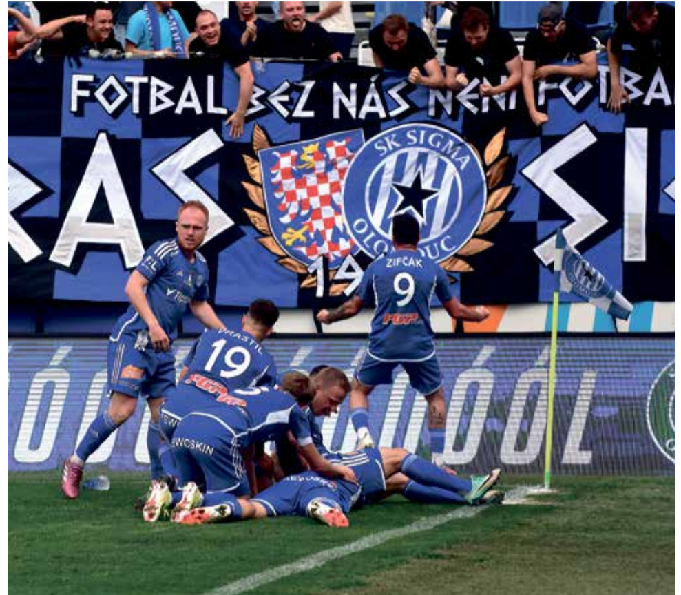
Fotbalisté SK Sigma Olomouc ukončili sedmizápasové domácí čekání na vítězství.

„Ze začátku jsme plnili to, co jsme chtěli. Pak šli domácí do deseti. Do druhé půlky jsme trochu přeskupili řady, ale nebyli jsme schopni vytvořit si šanci. Ty jsme měli jen po standardkách. Víme, v jakém stavu je Sigma, také hrála o všechno, ale nebyli jsme schopni si s ní poradit, i když byla v deseti,“ řekl trenér Jablonce Radoslav Látal. ■